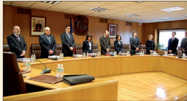
Minut de silenci en record dels morts de l'Hotel Normandia.

Actualment els diferents departaments estan redactant els plecs de bases per demanar aquestes ajudes segons uns criteris específics i en igualtat de condicions per a tothom. Vila va especificar per exemple que en matèria d'esports